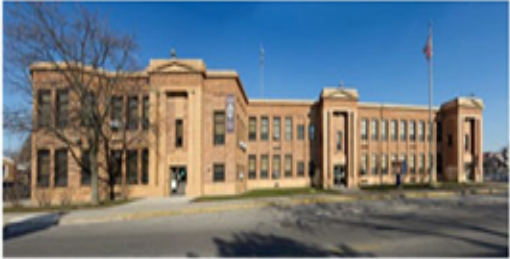
Jefferson Elementary School 7035 West 16th Street (708) 795-2454